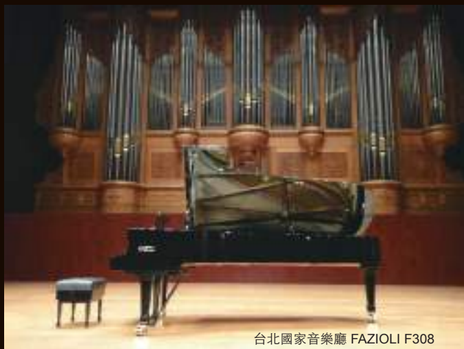
台北國家音樂廳 FAZIOLI F308